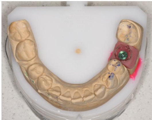
2. Išardomas modelis su kietų arba minkštų dantų imitacija bei pažymėtu dantų kontūru