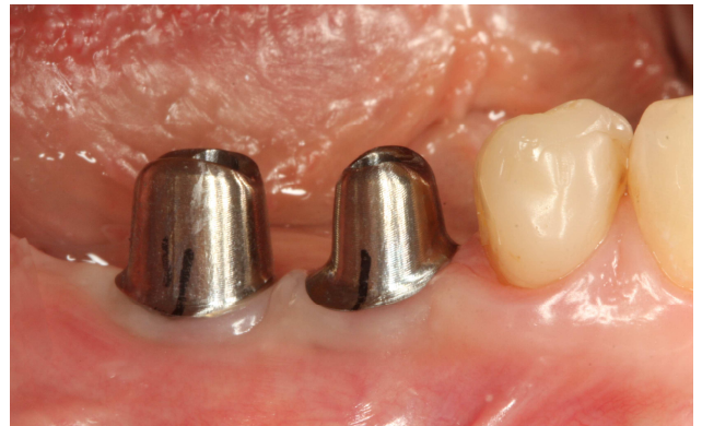
Titaninės frezuotos atramos