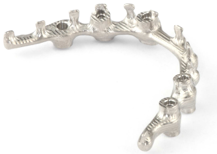
Titaninis prisukamas karkasas hibridiniam protezui