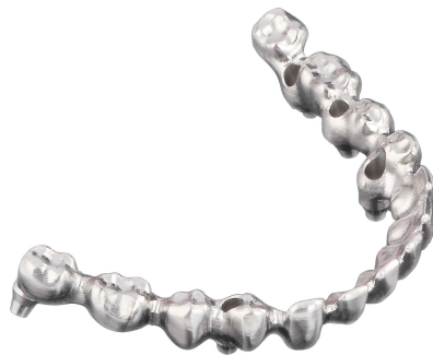
Cr-Co prisukamas metalo keramikos karkasas

Galima dirbti su visomis Lietuvoje parduodamomis implantų sistemomis